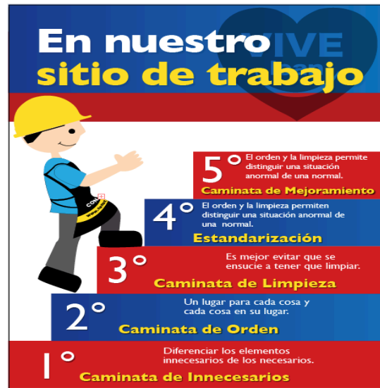
Grafica 4. Implementación gestión Visual. [7]

Grafico 3. La simbología busca garantizar el adecuado y buen manejo de cajas y sus productos desde las fabricas hasta el consumidor final, pasando por cada uno de los eslabones de la cadena de abastecimiento.