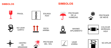
Grafico 3. La simbología busca garantizar el adecuado y buen manejo de cajas y sus productos desde las fabricas hasta el consumidor final, pasando por cada uno de los eslabones de la cadena de abastecimiento.

Realizar un diagnostico a los espacios determinados de acuerdo a la metodología 5s, que ayude a verificar como es la situación actual. Esta verificación se realizara bajo un check list el cual se tiene como ejemplo la grafica 2. En los anexos 1, 2 y 3 se encuentran las tablas completas de los check list de todas las áreas. En las áreas como recibo se debe apoyar las buenas practicas con ayudas visuales, por ejemplo imágenes que de los símbolos de las cajas para mejorar su manipulación