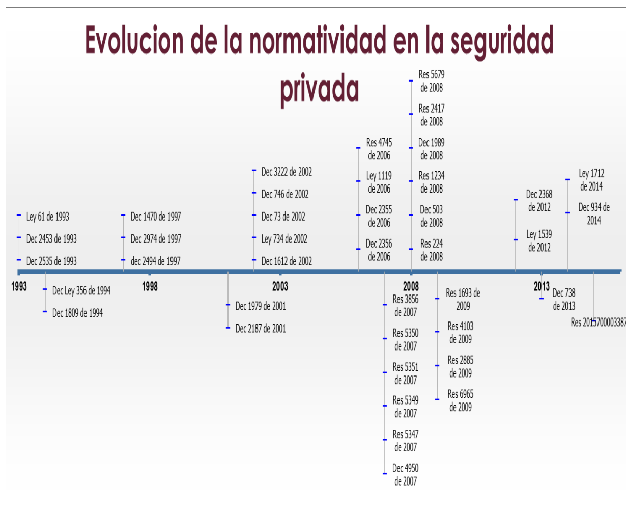
Figura 1. Evolución de la normatividad en la seguridad privada. Datos obtenidos de Franco (2016,p.2)

Decreto 2187 de 2001: Se Reglamenta el Estatuto de Vigilancia Decreto-ley 356/94: Definiendo acciones esenciales de la vigilancia y seguridad privada como las actividades que tienden a prevenir, detener, disminuir o disuadir las amenazas que afectan la vida o los bienes. (Supervigilancia , 2016), (Colombia, Ministerio de Defensa Nacional , 2001)