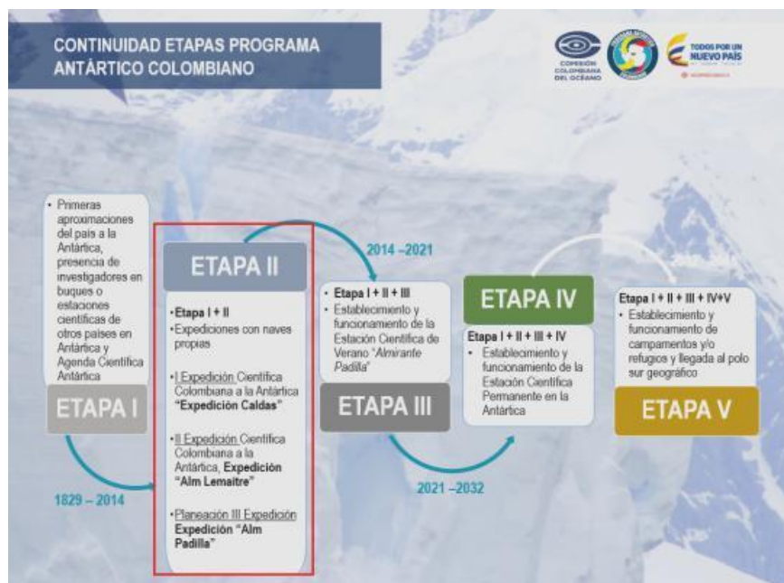
Ilustración 2. Etapas Programa Antártico Colombiano.

Etapas II Desarrollo de expediciones en plataformas propias A partir de los resultados alcanzados en la Etapa I, y con la finalidad de potencializar las labores de investigación científica nacional en la Antártica, se proyecta el envío bienal de plataformas propias al continente blanco. Esto contribuirá significativamente al desarrollo de las capacidades del país en cuanto a aspectos de desplazamiento, soporte y apoyo logístico para las investigaciones que se estructuren en ese continente (Comisión Colombiana del Océano, 2014).