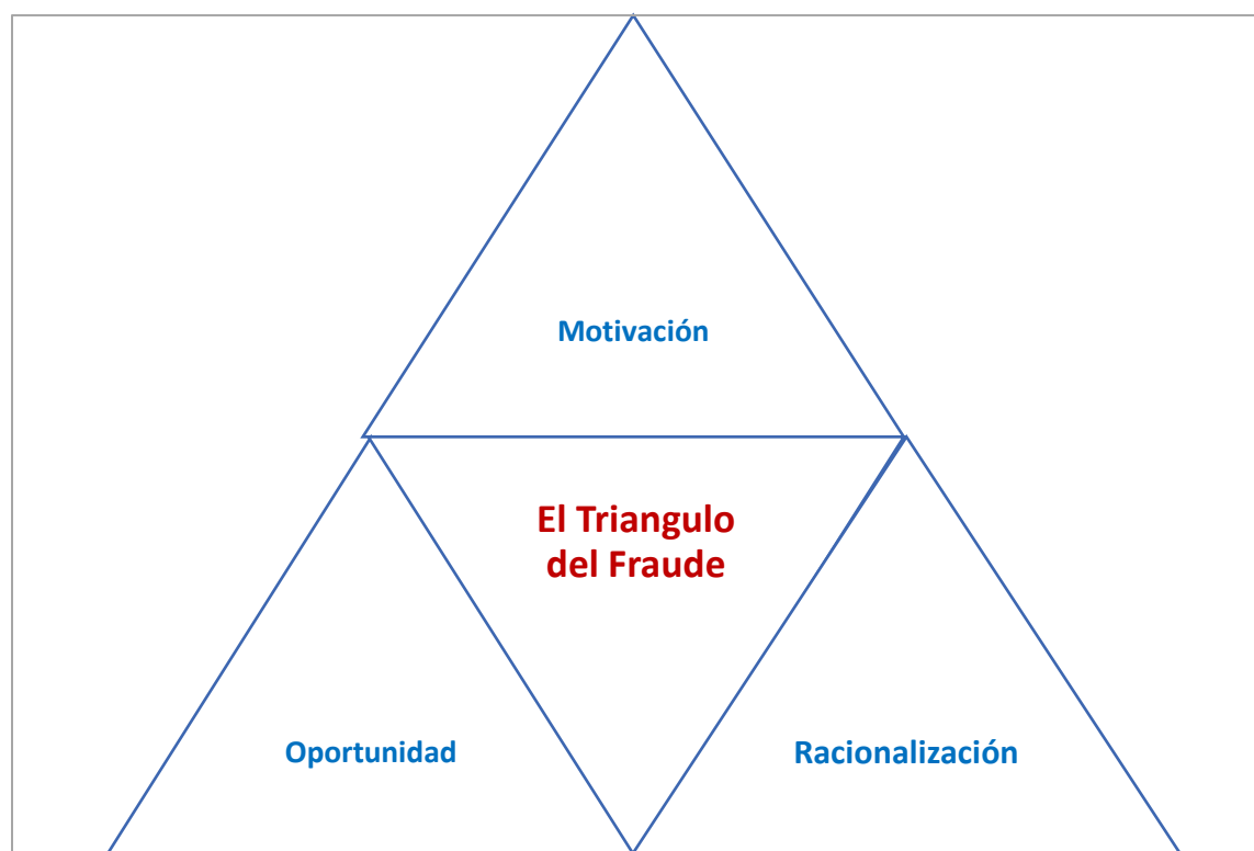
Figura 1- Triángulo del fraude-

En el marco de referencia sobre los distintos delitos y modalidades de pérdidas de mercancías en los almacenes de grandes superficies en la ciudad de Bogotá, fue preciso investigar sobre las teorías propuestas por el autor del triángulo del fraude, (Donald Cressey 1961). Criminólogo americano de quien se originó las teorías hoy vigentes sobre el triángulo del fraude, el cual se describe en la siguiente figura 1: La motivación, la racionalización y la oportunidad.