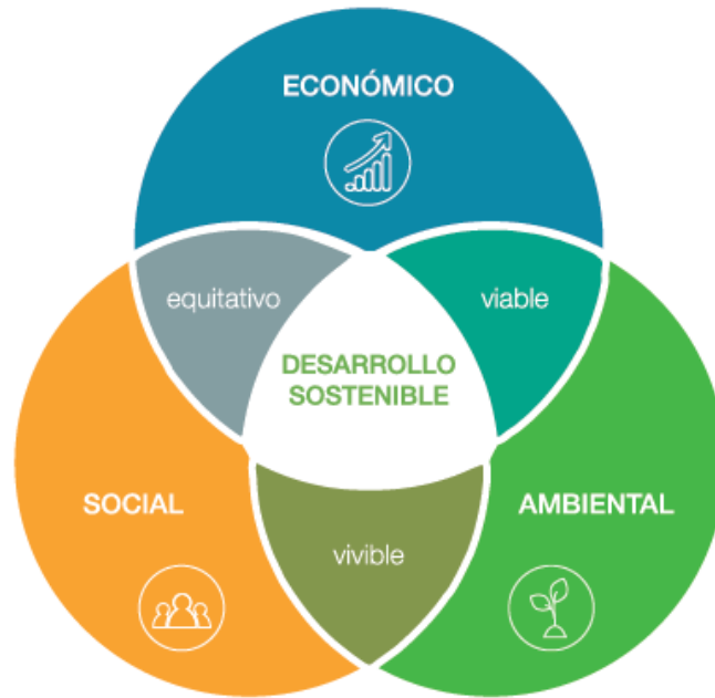
Figura 1. Esquema desarrollo sostenible.

Y teniendo claro que hay riesgo y que el mayor riesgo es no hacer ningún cambio, estos cambios direccionados a la transformación sostenible en las pymes se deben hacer de forma gradual, pensados a largo plazo con la tranquilidad de estar en el camino correcto para lograr a futuro obtener las ventajas y los beneficios que ofrece ser una empresa sostenible.