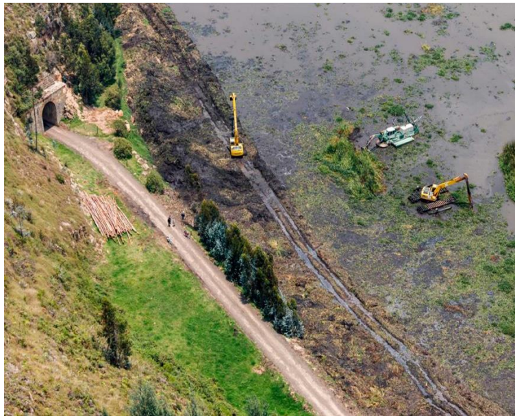
Imagen 2: Trabajo que realiza la CAR con su maquinaria para la extracción de sedimentos en el cuerpo de agua de la laguna de Fúquene.

Por otra parte, se ha aumentado el trabajo en la región, en especial se benefician las personas aledañas a la laguna.