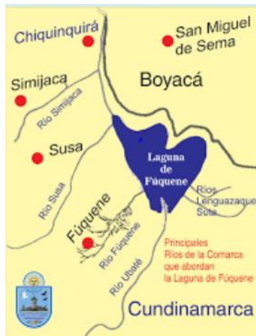
Imagen 1: Ubicación geográfica de la laguna de Fúquene.

Es así como a la fecha se cuenta con un inventario de 8.498 cuerpos de agua, que corresponden a 8432.5 hectáreas de humedales, dentro de los cuales se ha priorizado el complejo Lagunar Fúquene, Cucunubá y Palacio por ser de interés nacional y regional, para ser conservado, recuperado y usado sosteniblemente. (Proyecto Por Fúquene todos de corazón CAR 2017)