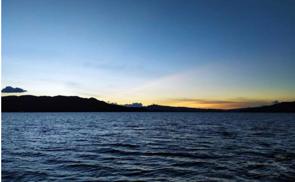
Imagen 4: Panorama de las áreas despejadas de la laguna de Fúquene.

Fúquene. (plan de gobernó Fúquene PG 86) Y así lograr incentivar el turismo en esta región