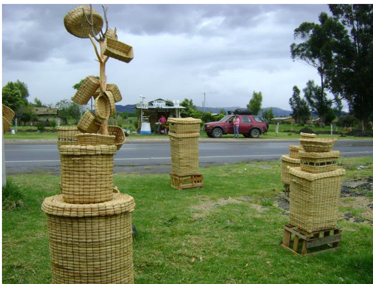
Imagen 3: Artesanías elaboradas por los artesanos de Fúquene.

Entre tanto, las consecuencias más notables son la pérdida de la fuente hídrica más importante de la región, el deterioro ambiental para la región y para el mismo país, la ausencia de participación ciudadana y una economía poco atractiva.