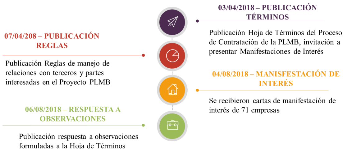
Ilustración 2. Manifestaciones de interés proceso concesión integral PLMB T1 Fuente: Elaboración propia a partir de información de la EMB, 2019

perseguidos en materia de movilidad para la capital colombiana. Seguidamente, se realizó la publicación del Término del Proceso de Contratación de la PLMB junto a la invitación pública a presentar Manifestaciones de Interés, invitación que fue acogida por 71 empresas que presentaron cartas para participar en la fase de precalificación, las fechas y detalles se presentan en la siguiente ilustración.