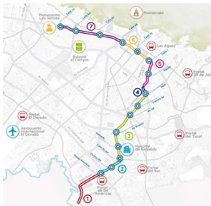
Ilustración 1. Trazado Primera Línea del Metro de Bogotá - Tramo 1

El recorrido de la PLMB T1 se extiende a través de 23,96 Km que atraviesan 9 localidades de la ciudad a saber: “localidades de Bosa, Kennedy, Puente Aranda, Barrios Unidos, Mártires, Antonio Nariño, Chapinero, Teusaquillo y Santafé, dentro de las cuales se ubicarán las dieciséis (16) estaciones del metro” (EMB, 2021), de tal manera, que la PLMB cruza de occidente a oriente la ciudad y emprende la búsqueda del norte de la capital por uno de los sectores más críticos en movilidad. Si bien es cierto que este primer tramo del metro no soluciona inmediatamente los graves problemas de movilidad de Bogotá, también es cierto que es un paso muy importante para empezar a materializar las soluciones que requiere la ciudad en materia de movilidad con un enfoque integral y a largo plazo.