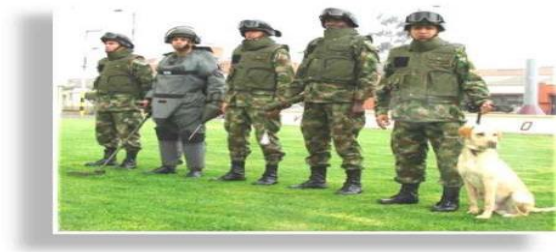
Figura No.03. Grupo Exde neutralizó 20 artefactos explosivos