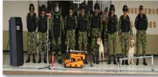
Figura No. 4. Grupo Marte Presentes en cada división del Ejército Nacional