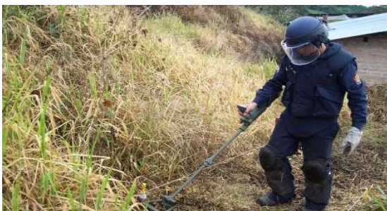
Figura No. 2. Desminado Humanitario.