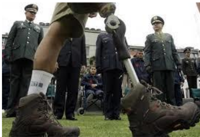
Figura No. 01. Atención a los sobrevivientes por parte las Fuerzas Militares de Colombia