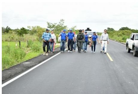
Figura No. 07. Proyecto vía de Tame con el caserío de Puerto San Salvador