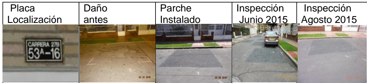
Figura 19. Registro fotográfico de los parches instalados por CIV: placa de localización del daño (a), daño antes de la intervención (b), parche instalado (c), inspección parche en junio 2015 (d), inspección del parche agosto 2015 (e)

CIV 13000937 Parche ejecutado el 27 de febrero de 2015 durante la noche en la KR 15A con CL 53 A CL53 B