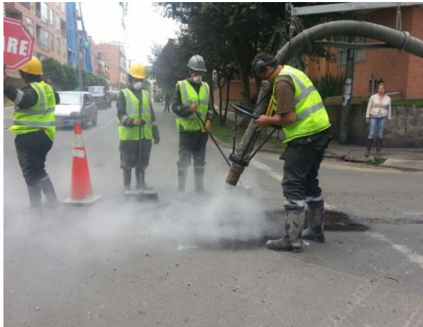
Figura 5. Limpieza del área afectada mediante un chorro de aire

Para este tipo de intervención no se requirió generar corte de la superficie alrededor del daño, y se procuró existiera una superficie rugosa de manera que se garantizara que la mezcla asfáltica instalada estuviera confinada y no se desplazara al paso de los vehículos, en algunos casos fue necesario el barrido de los escombros existentes en el área afectada, luego el operario realizó remoción del polvo y humedad presentes mediante un chorro de aire, dejando lista el área para su intervención como se observa en la figura 5.