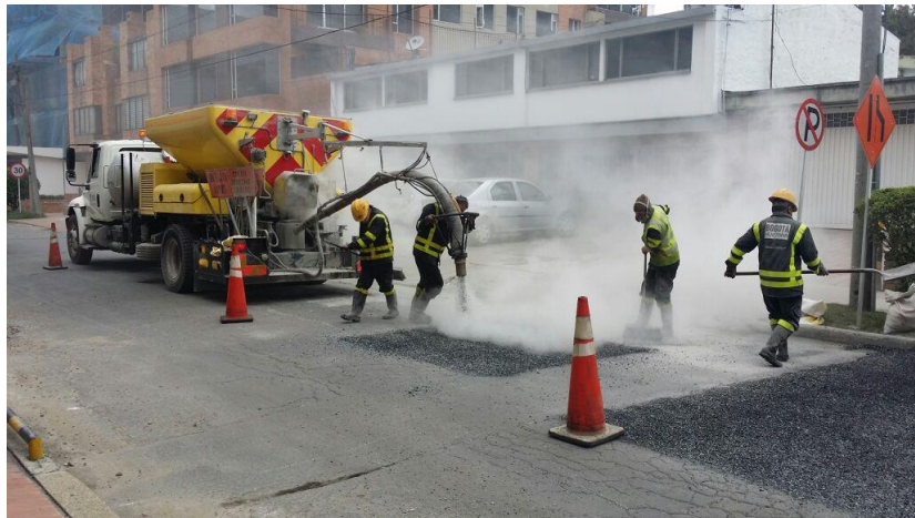
Figura 8. Cuantificación de área a intervenir.

Previo a la aplicación de la mezcla se verificó las condiciones del material a ser instalado (humedad aparente y limpieza), la mezcla en frío se inyectó mediante un chorro a presión de 40 PSI y a temperatura ambiente no menor a 10°C, se aplicó desde el centro de la superficie del hueco, mediante movimientos circulares o rectos de un lado a hacia otro de tal manera que se llenó homogéneamente toda el área.