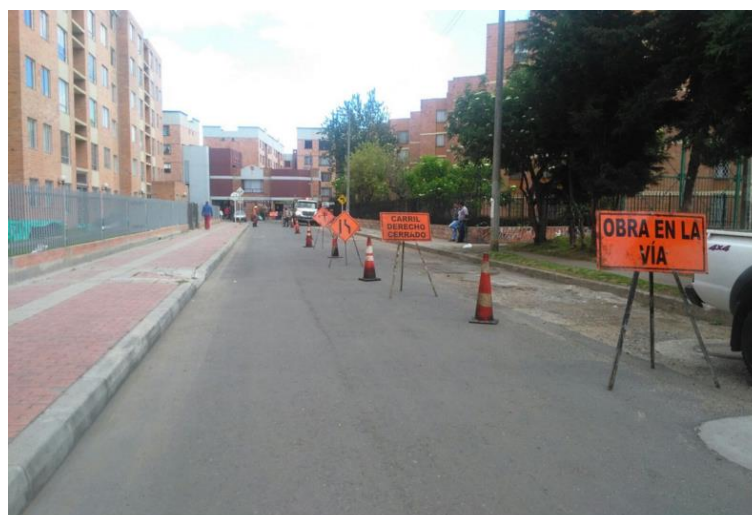
Figura 4. PMT implementado en punto de ejecución de los parches

En campo la primera actividad realizada fue la instalación de la señalización de acuerdo a los PMTs aprobados y según los requerimientos del sitio, se verificó la instalación como se muestra en la figura 4. Se observan los conos alrededor de la máquina, las señales verticales preventivas y la ubicación de los controladores de tráfico; con el fin de mantener la movilidad segura y eficiente.