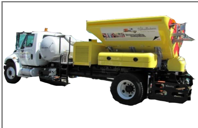
Figura 1. Máquina tapa huecos