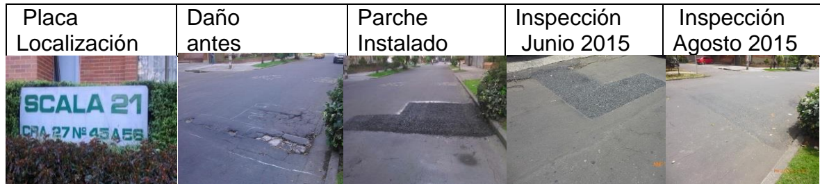
Figura 18. Registro fotográfico de los parches instalados por CIV: placa de localización del daño (a), daño antes de la intervención (b), parche instalado (c), inspección parche en junio 2015 (d), inspección del parche agosto 2015 (e)

CIV 13001388 Parche ejecutado el 27 de febrero de 2015 durante el día en la KR 27 con CL 46 a 45 A