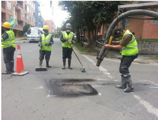
Figura 7. Cuantificación de área a intervenir.

Realizada la limpieza y cuantificación del hueco el operador llevó a cabo un riego de imprimación con emulsión de rompimiento rápido CRR2 (emulsión catiónica de rompimiento rápido) como se observa en la figura 7.