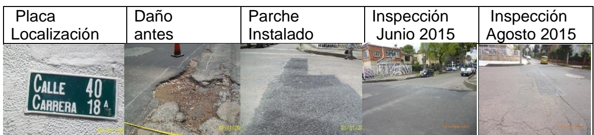
Figura 17. Registro fotográfico de los parches instalados por CIV: placa de localización del daño (a), daño antes de la intervención (b), parche instalado (c), inspección parche en junio 2015 (d), inspección del parche agosto 2015 (e)

CIV 13000794 Parche ejecutado el 24 de febrero de 2015 durante el día en la CI 40 entre KR 18 y 18 A