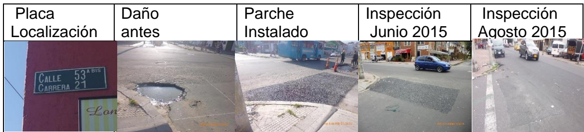
Figura 16. Registro fotográfico de los parches instalados por CIV: placa de localización del daño (a), daño antes de la intervención (b), parche instalado (c), inspección parche en junio 2015 (d), inspección del parche agosto 2015 (e)

CIV 13000966 Parche ejecutado el 18 de febrero de 2015 durante el día en la CL 53 A BIS entre KR 21 y 22.