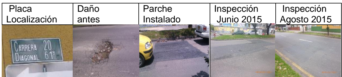
Figura 15. Registro fotográfico de los parches instalados por CIV: placa de localización del daño (a), daño antes de la intervención (b), parche instalado (c), inspección parche en junio 2015 (d), inspección del parche agosto 2015 (e)

CIV 13000336 Parche ejecutado el 20 de febrero de 2015 durante el día en la DG 61 B 40 entre KR 19 y 20.