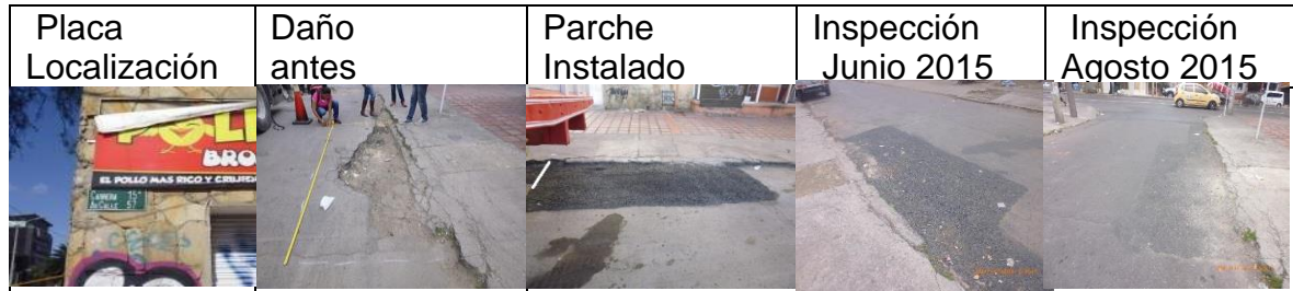
Figura 12. Registro fotográfico de los parches instalados por CIV: placa de localización del daño (a), daño antes de la intervención (b), parche instalado (c), inspección parche en junio 2015 (d), inspección del parche agosto 2015 (e)

CIV 13000802 Parche ejecutado el 16 de febrero de 2015 durante el día en la KR 15A con AC 57 a CL58