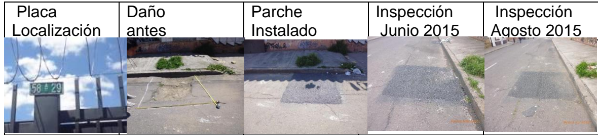
Figura 11 Registro fotográfico de los parches instalados por CIV: placa de localización del daño (a), daño antes de la intervención (b), parche instalado (c), inspección parche en junio 2015 (d), inspección del parche agosto 2015 (e)

CIV 3000696 Parche ejecutado el 16 de febrero de 2015 durante el día en la KR14 con CL 58 A 58 B