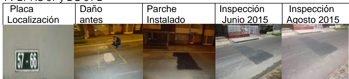
Figura 9. Registro fotográfico de los parches instalados por CIV: placa de localización del daño (a), daño antes de la intervención (b), parche instalado (c), inspección parche en junio 2015 (d), inspección del parche agosto 2015 (e)

CIV 13000675 Parche ejecutado el 15 de febrero de 2015 durante la noche en la TV 27 AC 57 y DG 61 B