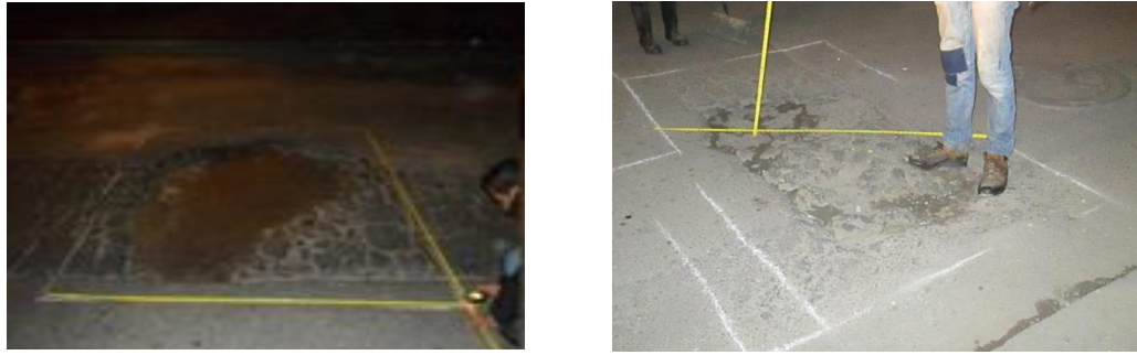
Figura 6. Cuantificación de área a intervenir: área del hueco(a), espesor del hueco (b)