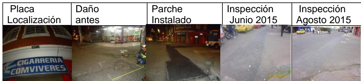
Figura 13. Registro fotográfico de los parches instalados por CIV: placa de localización del daño (a), daño antes de la intervención (b), parche instalado (c), inspección parche en junio 2015 (d), inspección del parche agosto 2015 (e)

CIV 13000871 Parche ejecutado el 17 de febrero de 2015 durante el en la noche KR 15 con CL 56 a 57