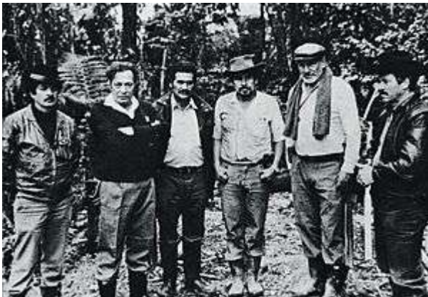
Figura 1. Fundadores de las FARC en Marquetalia. De izquierda a derecha: Fernando Bustos, Manuel Marulanda, Jaime Guaracas, Miguel Pascuas y Rigoberto Lozada http://www.peacepalacelibrary.nl/2012/11/colombia-at-last-peace-with-the-farc/

1.1 Las FARC y sus orígenes: Las Fuerzas Armadas Revolucionarias de Colombia (FARC) existen desde el año 1964, surgiendo desde la selva Colombiana con el objetivo que asegura su carta fundacional “acabar con las desigualdades sociales, políticas y económicas, la intervención militar y de capitales estadounidenses en Colombia mediante el establecimiento de un Estado marxista-leninista y bolivariano”. La muerte de Jorge Eliecer Gaitán dirigente político de gran acogida por el pueblo colombiano desata el llamado “bogotazo”, produciendo así el desencadenamiento de una lucha y violencia sin precedentes, lo que genera que un grupo de liberales radicales se interne en zonas de difícil acceso a la fuerza pública e inicie una serie de luchas ideológicas y militares en cabeza de Manuel Marulanda Vélez alias “TIROFIJO” y Jacobo Arenas quienes serían en el tiempo los fundadores de la guerrilla más grande y antigua del mundo.