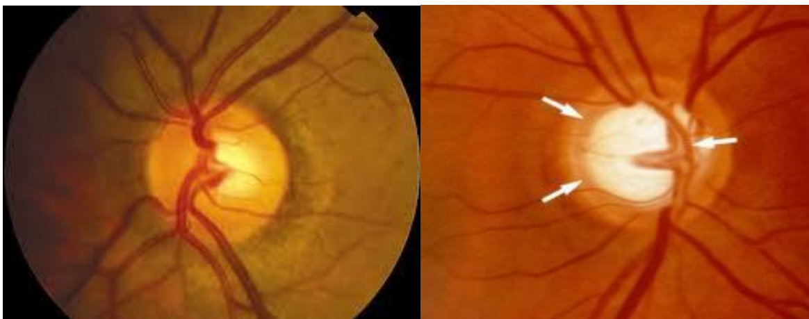
Figura, 3. 3.1. Excavación normal

Se define como un padecimiento crónico de etiología variada, caracterizado por neuropatía óptica y un aumento de la presión intraocular, la cual posee un rango de (10-20 mmHg) con una media 16mmHg, constituye la segunda causa de discapacidad visual en el mundo, luego de la catarata. La organización mundial de la salud (OMS) determino en un análisis de la incidencia, la prevalencia y la gravedad de los distintos tipos de glaucoma en todo el mundo a finales de los años ochenta e inicios de los noventa, que el número total de personas con PIO alta (>21 mmHg) era de 104,5 millones. La prevalencia de ceguera para todos los tipos de glaucoma se cifro en más de 3.1 millones de personas.