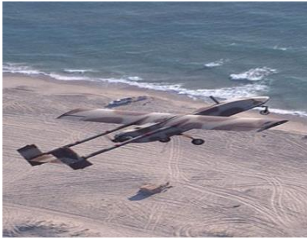
Imagen 7 UAV IRIS en los vuelos de prueba Fuente FAC anunció la creación de Iris: el nuevo avión de combate ... http://www.radiosantafe.com/2013/10/12/fac-anuncio-la-creacion-de-iris-el-nuevo-avion-de-co .

Imagen 6 UAV IRIS en proyecto de construcción Fuente FAC anunció la creación de Iris: el nuevo avión de combate ... http://www.radiosantafe.com/2013/10/12/fac-anuncio-la-creacion-de-iris-el-nuevo-avion-de-co .