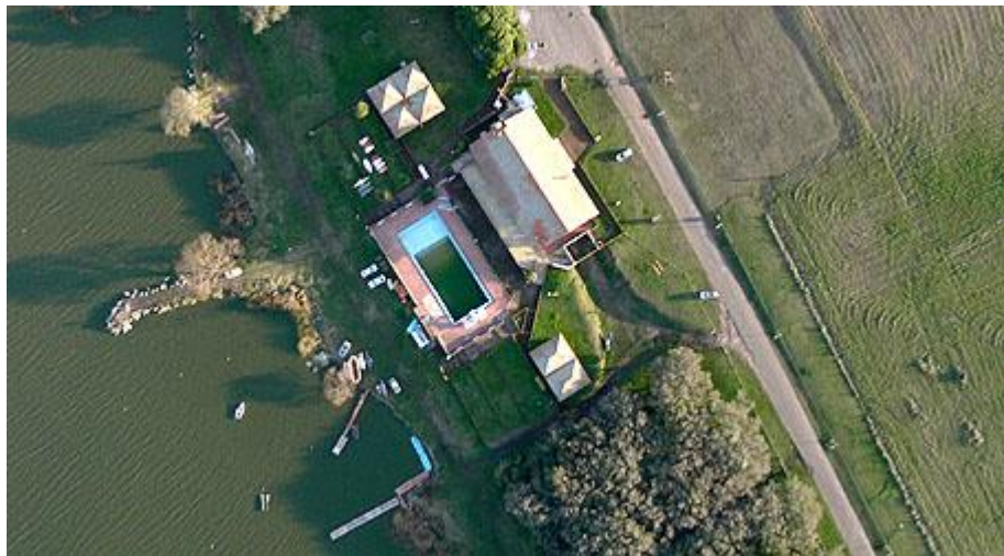
Imagen 4 Toma fotográfica desde un UAV Fuente Vehículos aéreos no tripulados para uso civil. Tecnología - Unizar, http://webdiis.unizar.es/.../ABarrientos-CEDI2007.pdf .

En la imagen No. 4, podemos observar el resultado de la toma de una fotografía realizada por una aeronave NO tripulada sobre un área u objetivo previamente seleccionado.