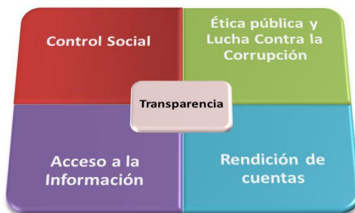
Ilustración 3 Acción Política Global (Wordpress, 2012)

No podemos dejar atrás la ética, como servidor público se está dispuesto en prestar el servicio ejerciendo las funciones de su cargo de tal manera que las motivaciones y procedimientos (procesos) sean transparentes y faciliten, en consecuencia, el ejercicio del derecho ciudadano de controlar los actos del gobierno y la administración.