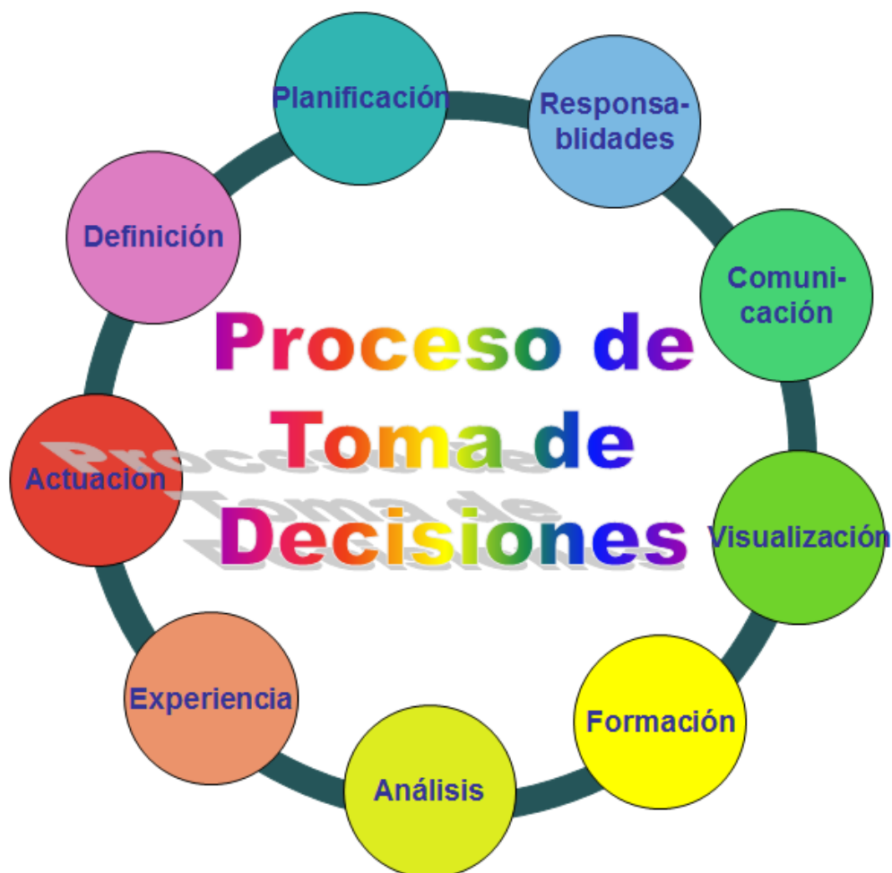
Ilustración 2 Decisiones y tecnología.