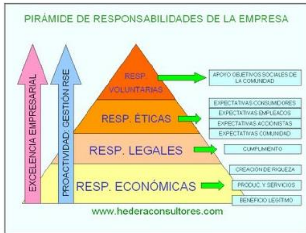
Figura 1 Pirámide de Responsabilidad Empresarial

Podemos apreciar una construcción de importancia basadas en lineamientos de funcionamiento que proceden dentro de una organización, cada impacto de Responsabilidad generar un ciclo de regulación que permite abrir un campo de vinculación con la Comunidad.