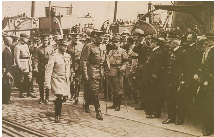
General Pershing, a su llegada al puerto de Boulogne-sur-Mer, Francia. 1917.

La fotografía que muestra el arribo del general John J. Pershing, designado comandante de las fuerzas estadounidenses, a Boulogne-sur-Mer el 13 de junio de 1917, constituye el registro histórico de la presencia de los Estados Unidos como potencia emergente en el panorama mundial. Desde entonces, el intervencionismo político, económico y militar de ese país en Europa no ha cesado; su autodesignación como “faro de la democracia” lo ha estimulado. Para el caso que nos ocupa, y a raíz de la determinación alemana de desarrollar sin miramientos una guerra submarina que había traído como consecuencia el hundimiento de buques mercantes de los Estados Unidos, este país