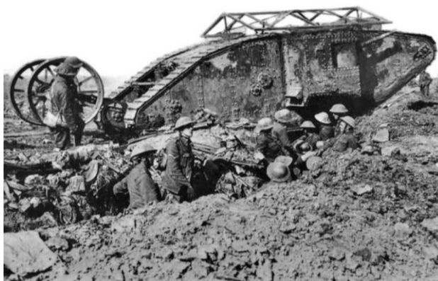
Imagen 4. Batalla del Somme

Como un hecho de interés para el historiador, el citado autor indicó que fue en este combate en el que entró en acción el carro de combate: “al principio el avance de los carros fue triunfal, pero algunos quedaron sin combustible, otros se hundieron en el lodo y el ataque se estancó”.