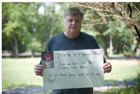
Foto 3, hombres que fueron víctimas de violencia sexual que decidieron mostrar su rostro al mundo, y mostrar las frases de sus perpetradores