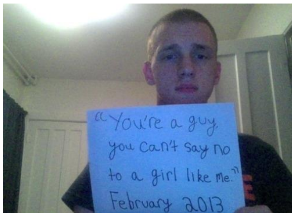
Foto 1, hombres que fueron víctimas de violencia sexual que decidieron mostrar su rostro al mundo, y mostrar las frases de sus perpetradores, tomado de www.theclinic.cl