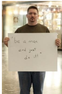
Foto 4, hombres que fueron víctimas de violencia sexual que decidieron mostrar su rostro al mundo, y mostrar las frases de sus perpetradores, tomado de www.theclinic.cl