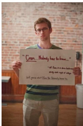
Foto 1, hombres que fueron víctimas de violencia sexual que decidieron mostrar su rostro al mundo, y mostrar las frases de sus perpetradores, tomado de www.theclinic.cl