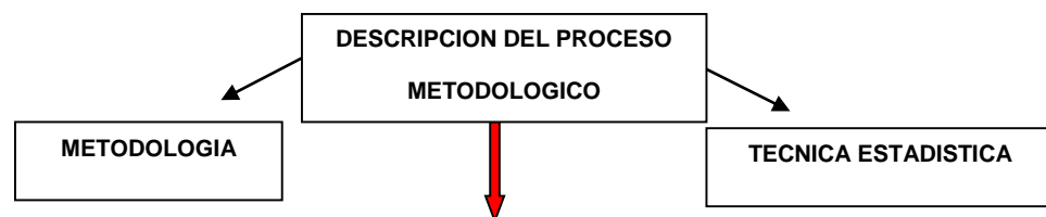
Figura 2. Pasos y etapas del proceso metodológico