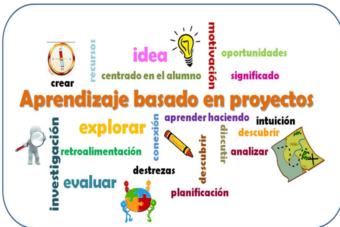
Figura N.3 Universidad Francisco Marroquín .Guatemala. Taller aprendizaje basado en proyectos. http://educacion.ufm.edu

proyectos ha sido altamente difundido especialmente en movimientos de educación popular, pues es una estrategia de investigación, aprendizaje y en gran medida de acción comunitaria usada como instrumento de promoción social y de gestión de cambios.