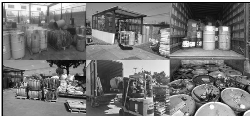
Figura 3. RESPEL

Las operaciones identificadas fueron el rectificando, cobrizado, cromado, mezcla de tintas, rotograbado, lavado, laminado y refilado. Gracias a estas se obtuvieron 4 desechos o materiales peligrosos distintos en cantidades y presentaciones determinadas que en la Figura 3 se visualizan con su respectivo embalaje.