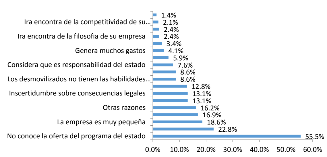
Gráfico No. 1: Razones para abstenerse de vincular desmovilizados.

Las empresas pequeñas tienen menor participación en el proceso del posconflicto y menor aceptación de iniciativas, dado que sus estructuras y son más pequeñas y más débiles para fomentar la inclusión de los desmovilizados en sus empresas, donde estas se evidencian en el siguiente gráfico.