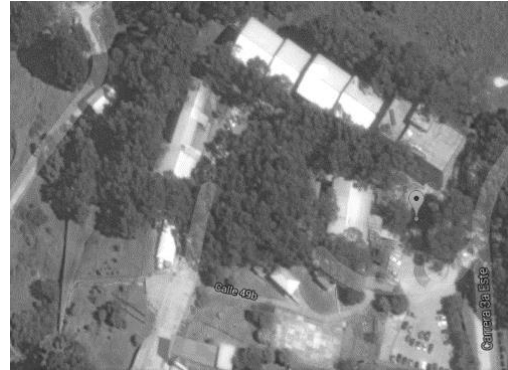
Imagen 1. Factores incidentes en la percepción de Ruido UAN- Sede circunvalar

el deterioro de la estructura física de las edificaciones de la zona, debido a que la mayoría son construcciones antiguas cuyos materiales son fácilmente degradables.