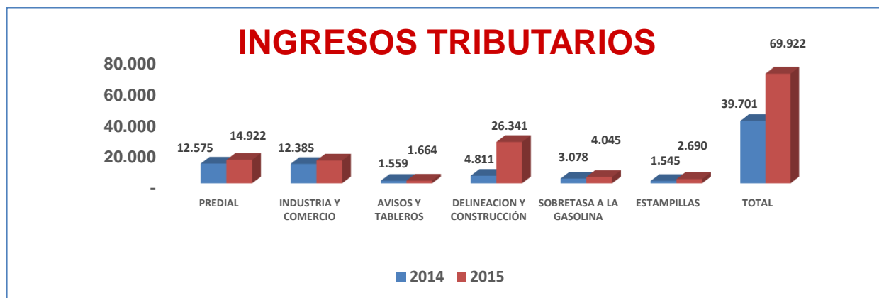
Grafica 1 Ingresos Tributarios

Los ingresos tributarios totales al cierre de 2015, ascendieron a 69.922 millones de pesos, incrementaron 76% frente a lo recaudado en 2014, el mayor crecimiento se presenta en el Impuesto de Delineación y Construcción, dado por la entrada en vigencia del Plan Básico de Ordenamiento Territorial, mediante el acuerdo 016 de 2014. Otros crecimientos, Predial 19%, Industria y Comercio 17%, Avisos y Tableros 7%, Sobretasa a la Gasolina 31%, Estampilla Pro Adulto Mayor 74%, este último, dado por el nivel de contratación de obra pública. (Alcaldía Municipal de Cajicá, 2016)