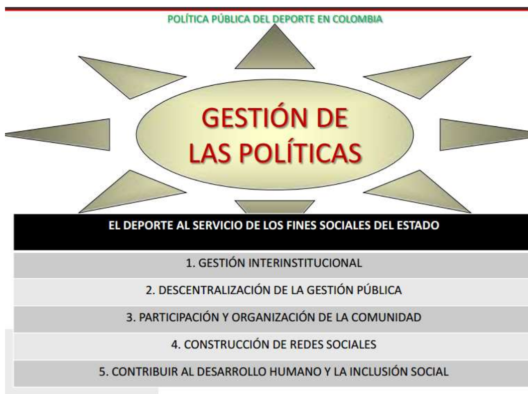
Grafica 3 Política pública del deporte en Colombia el derecho al deporte gestión de las políticas (Ley 181 de 1995, 2013)

El marco internacional es mucho más amplio y en temas de derechos humanos la población vulnerable es protegida por diferentes organismos o sistemas internacionales que respaldan y defienden a través de la declaración universal de los derechos humanos, todo abandono y desprotección. Sin embargo la acción social de las exigencias de las cortes está sometida al alcance y la eficiencia del Estado al impartir acciones relevantes que evidencien protección.