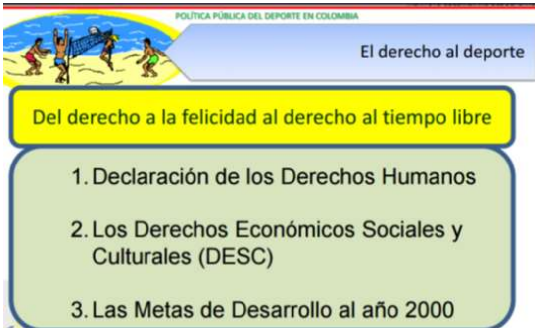
Grafica 2 Política pública del deporte en Colombia el derecho al deporte (Ley 181 de 1995, 2013)

Así mismo la CEPAL en un informe de 2011 acerca sobre las normas y política regionales y nacionales sobre las personas mayores, expone los derechos protegidos en las normas nacionales dedicadas a las personas mayores en el que Colombia particularmente para 2008 protegió cinco (5) derechos de seis (6) que presenta el informe y en el que no protege derecho a la salud física y psíquica .