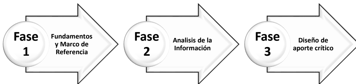
Figura 1. Diseño metodológico de la investigación

El diseño de la investigación propuesta destaca el cumplimiento de tres fases que permitan abordar el tema de estudio de forma apropiada, en tal sentido es pertinente recopilar información relevante sobre los posibles efectos del postconflicto en el sector industrial y estrategias de afrontamiento desde el ámbito económico. Posteriormente es necesario efectuar un análisis profundo de la información recolectada con el fin de estructurar ideas que fortalezcan el contenido investigativo e incorpore posturas sobre la situación de las industrias en un panorama completamente nuevo dentro del contexto nacional después de 50 años de conflicto armado interno. Finalmente, el autor incorpora su pensamiento crítico empleando fundamentos de la Alta Gerencia para evaluar la situación en todo su conjunto y poder desarrollar el tema de acuerdo a los parámetros que aportan los conocimientos en prospectiva estratégica, pensamiento complejo y direccionamiento estratégico de la Especialización.