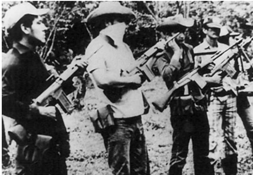
Ilustración 1 La Historia de las FARC desde sus inicios

Las Fuerzas Armadas Revolucionarias de Colombia (FARC) surgieron en 1964 en la selva del país latinoamericano con el objetivo de “acabar con las desigualdades sociales, políticas y económicas, la intervención militar y de capitales estadounidenses en Colombia mediante el establecimiento de un Estado marxista-leninista y bolivariano”, según asegura su carta fundacional. (Perfil.com, 2008)