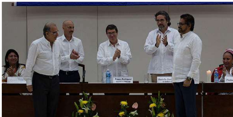
Ilustración 4 1El Gobierno y las Farc pactaron la creación de un "Sistema Integral de Verdad, Justicia, Reparación”

Se inició a hablar de justicia transicional, cuando básicamente inicio las conversaciones con las Fuerzas Armadas Revolucionarias de Colombia oficialmente el 4 de septiembre de 2012, resumiendo su postura en tratar de definir como los miembros de este grupo subversivo van a pagar las condenas que se les van a imponer por el sin número de delitos de lesa humanidad que han cometido en más de seis décadas. Paralelo a esto existe una circunstancia al interior del Ejército y es el alto número de militares procesados y condenados por delitos cometidos durante el servicio y con relación al conflicto armado, esta coyuntura abre la puerta para que se aplique también una justicia transicional para los militares.