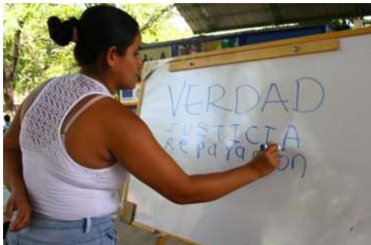
Ilustración 6 Justicia Transicional

La justicia transicional es la manera de hacer justicia en contextos de transición política. Cuando se trata de ponerle fin a conflictos armados internos, la justicia transicional contribuye a conseguir -al mismo tiempo- dos objetivos esenciales: la negociación política del conflicto y la realización de la justicia. Para ello, la justicia transicional pone a disposición una serie de mecanismos y herramientas especiales que permiten enfrentar el legado de violaciones masivas a los derechos humanos, buscando el reconocimiento de las víctimas y la construcción de confianza entre los ciudadanos, y entre éstos y el Estado.” (JEP, 2016, pág. 2)