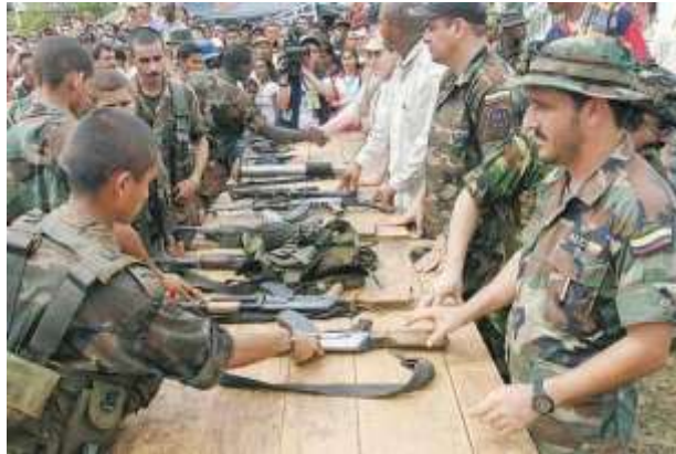
Ilustración 3 Entrega de armas AUC

O Ley 975 de 2005, fue diseñado como un marco jurídico para que las mal llamadas autodefensas unidas de Colombia, durante el gobierno de Álvaro Uribe Vélez que desmovilizo a más de 35 mil combatientes de esta organización al margen de la ley, permitiéndole a la mayoría de los miembros que se acogieron a ellas pagar una condena de ocho años de prisión por sus delitos de lesa humanidad. “La investigación, procesamiento, sanción y beneficios judiciales de las personas vinculadas a grupos armados organizados al margen de la ley que decidan desmovilizarse y contribuir decisivamente a la reconciliación nacional y a garantizar los derechos de las víctimas.” (jep, s.f., pág. 1)