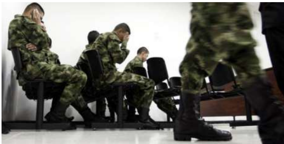
Ilustración 5 24.000 militares y policías irían a la justicia transicional

Debido al incremento de investigaciones por muertes extrajudiciales, los hombres del Ejército pueden ver una salida a su situación jurídica con la justicia especial para la paz, necesariamente realizando un sometimiento a la misma y a las condiciones que se plantea. Que es básicamente la verdad, la justicia y la reparación, en este orden de ideas se busca conocer cuáles fueron las causas del proceder, a que se vieron motivados y observar como en determinado momento de los años 2006 al 2008, todas las guarniciones de Colombia se reportaban muertes con unas características especiales muy particulares e idénticas.