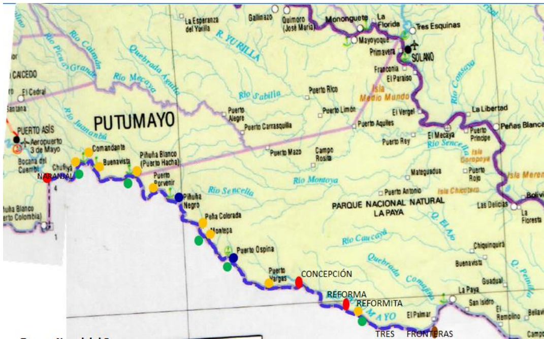
Grafica No 1 Salazar; Lina 2017 [modificado] Ruta para la realización de la Jornada de Apoyo al desarrollo Colombia- Ecuador autoría propia

Para cumplir con los lineamientos derogados de la acción integral, los países involucrados han desarrollado estrategias para el desarrollo de los mismos mediante el Control Fluvial se materializa mediante la doctrina de operaciones ribereñas, y el segundo, la estrategia de “Acción Social con Sostenibilidad” pretende contribuir a garantizar el sostenimiento de los programas de Estado en cuanto a la atención de la población en salud, nutrición y educación. (Iriarte, 2014) (Ramírez S. , 2006)