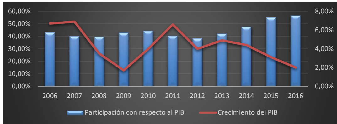
Gráfico No. 2. Comportamiento de la Deuda Pública con respecto al PIB