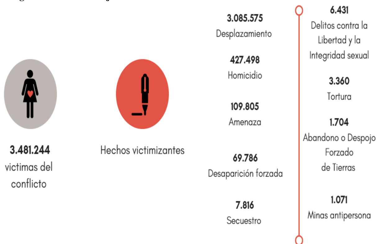
Figura 2. Cifras de mujeres víctimas en el conflicto

Figura 2. Cifras de mujeres víctimas en el conflicto. Elaboración propia. Información obtenida de Unidad de Víctimas (2017).