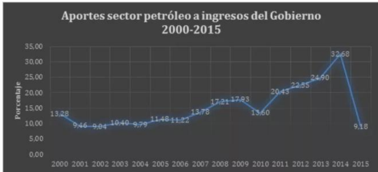
Gráfico N° 2

De acuerdo con el Grafico 1 se puede analizar que el Estado Colombiano recibe ingresos petroleros por derechos de la Agencia Nacional de Hidrocarburos (ANH), por regalías, por Impuesto de Renta y por los dividendos que genera Ecopetrol, de este modo el total de aportes del sector petrolero a Colombia entre el 2006 y el 2015 fue de 61,6 billones de pesos, así mismo se evidencia que en el año 2015 fue cuando no hubo dividendos del año 2014, de igual forma entre el año 2014 y 2015 cuando se presentó la caída en los precios del crudo, se presentó un descenso el cual refleja un 65% de los ingresos percibidos.