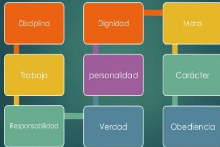
Ilustración 2: Valores de la ética profesional

La ética es una guía para la conducta humana que proporciona un criterio para orientar nuestros actos en una línea valiosa. La cuestión de la ética es la parte axiológica dado que todos los problemas giran alrededor de la bondad moral; es normativo porque, aunque no elabore normas, sin embargo, sus conclusiones se aplican como criterios y fundamentos para que otras áreas puedan formular sus normas; se aplica a todas las situaciones en las cuales el desempeño profesional debe seguir un sistema tanto implícito como explícito de reglas morales de diferente tipo. La ética profesional puede variar en términos específicos con cada profesión, dependiendo del tipo de acción que se lleve adelante y de las actividades a desarrollar; sin embargo, hay un conjunto de normas de ética profesional que se pueden aplicar a grandes rasgos a todas o a muchas de las profesiones actuales. La ética profesional también puede ser conocida como deontología profesional. (ITAM, 2011)