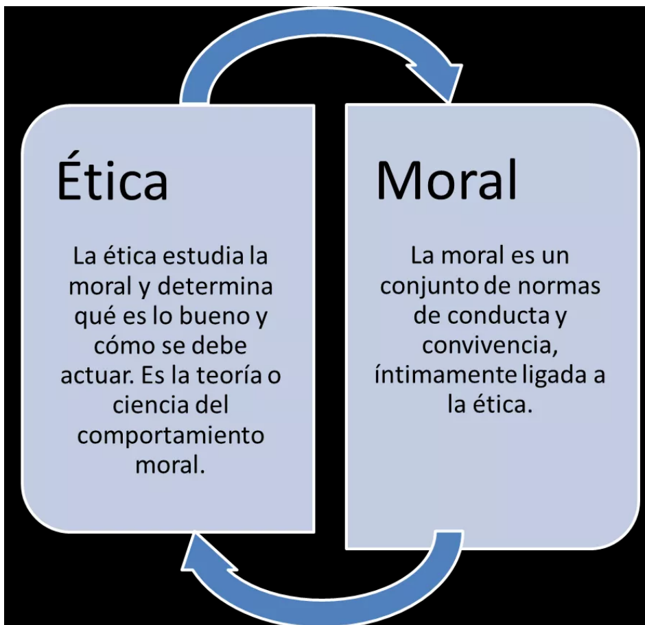
Ilustración 1: Ética y moral

El hombre constantemente se hace preguntas éticas cada vez que piensa en cómo debe actuar. Ser ético es una parte de lo que define al hombre como seres humanos, ya que éste es racional, piensa, elige. Todos tienen la capacidad de tomar decisiones conscientes, aunque a menudo se actúa por costumbre o en línea con las opiniones de la multitud. Podrían hacer elecciones conscientes y conscientes si se quiere.