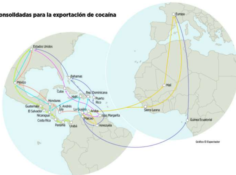
Gráfico El Espectador