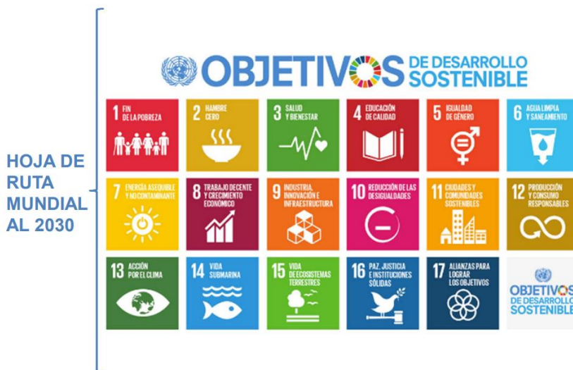
Figura 1. Tomado de La Cooperación Internacional en Colombia: retos y oportunidades para Bogotá. (Escuela de gobierno local, 2017)

La educación de calidad es uno de los primeros en orden de prioridad como se evidencia en la figura 1 .