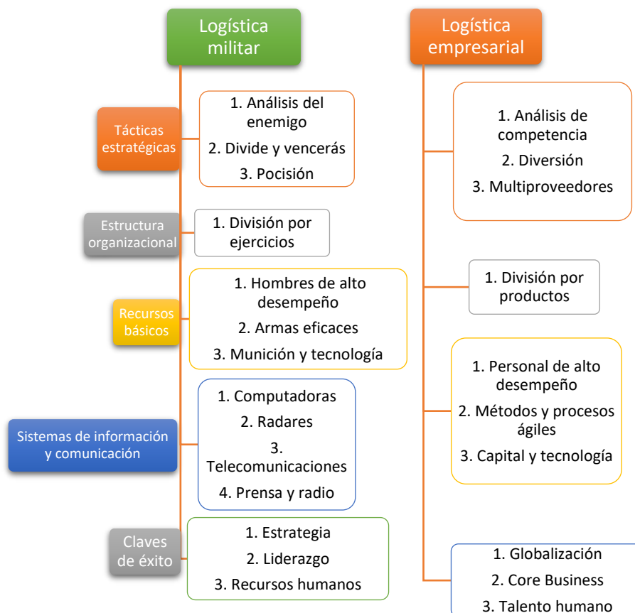
Figura 1. Cuadro comparativo entre la logística militar y empresarial

Desde tiempos remotos la logística ha estado relacionada con el área militar, lo que ha permitido que este concepto se utilice no solamente en este tipo de instituciones sino también en las organizaciones empresariales, por lo que existen ciertas afinidades entre la logística militar y la logística empresarial. En la Figura. 1 se muestran la relación que existen entre estos dos tipos de logística.