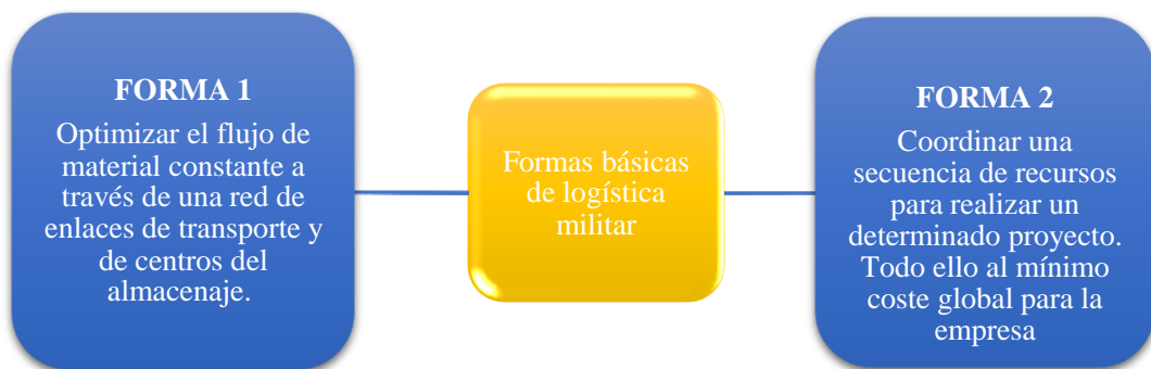
Figura 2. Formas básicas de logística militar

BRLOG (s.f) refiere que la logística en el área militar delimita cómo y cuándo movilizar los diferentes suministros a los lugares donde son necesarios. De forma que el objetivo primordial es mantener las líneas de suministro propias e interrumpir las del enemigo ya que una fuerza armada sin alimentos o combustible es algo inútil. En el ámbito militar predominan dos formas básicas de logística (ver Figura. 2).