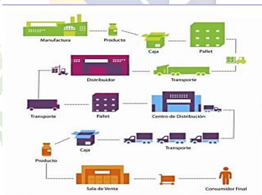
Grafica N°2 cadena de suministro

Para comprender los riesgos que se pueden presentar en la cadena de suministros, es importante saber cómo está compuesta; para ello el siguiente gráfico señala alguno de los actores que logran participar en la cadena de suministros de un exportador y observar los momentos que tiene que vivir el comercio de una mercancía; momentos que son susceptibles a riesgos, además se evidencia que en el mismo se involucran diferentes actores sobre los cuales hay que mantener control para evitar cualquier vulneración de la seguridad y por ende del producto.