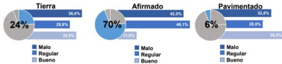
Fig.1. Estado de la red vial en Km.

En la figura No.1 se muestran las valoraciones en kilómetros de la situación de las condiciones de las vías terciarias (Afirmado, en tierra o pavimentada) y el nivel de funcionamiento en el que se encuentran (malo, regular y bueno), según datos arrojados por el DNP – Ministerio de Transporte para el año 2016. Indicando que la gran parte de la red vial terciaria se halla en estado de afirmado y esta a su vez en estado regular.