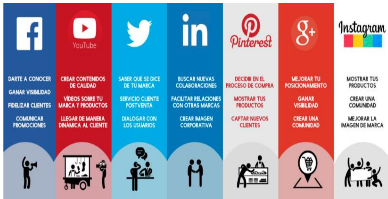
Figura 2. Características uso redes sociales