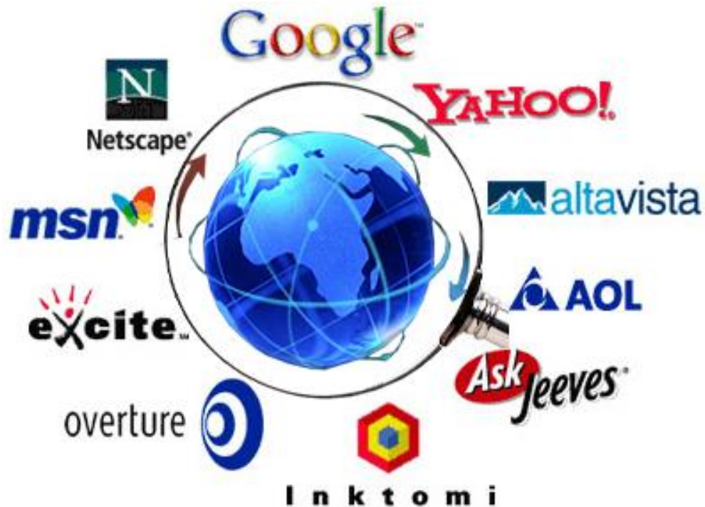
Figura 3. Motores de Búsqueda