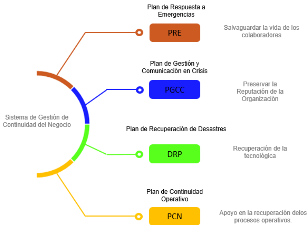
Figura 3 Planes del sistema de continuidad del negocio.

Los principales elementos en la gestión de continuidad del negocio que apalancan la toma de decisiones por la alta gerencia corresponden a: