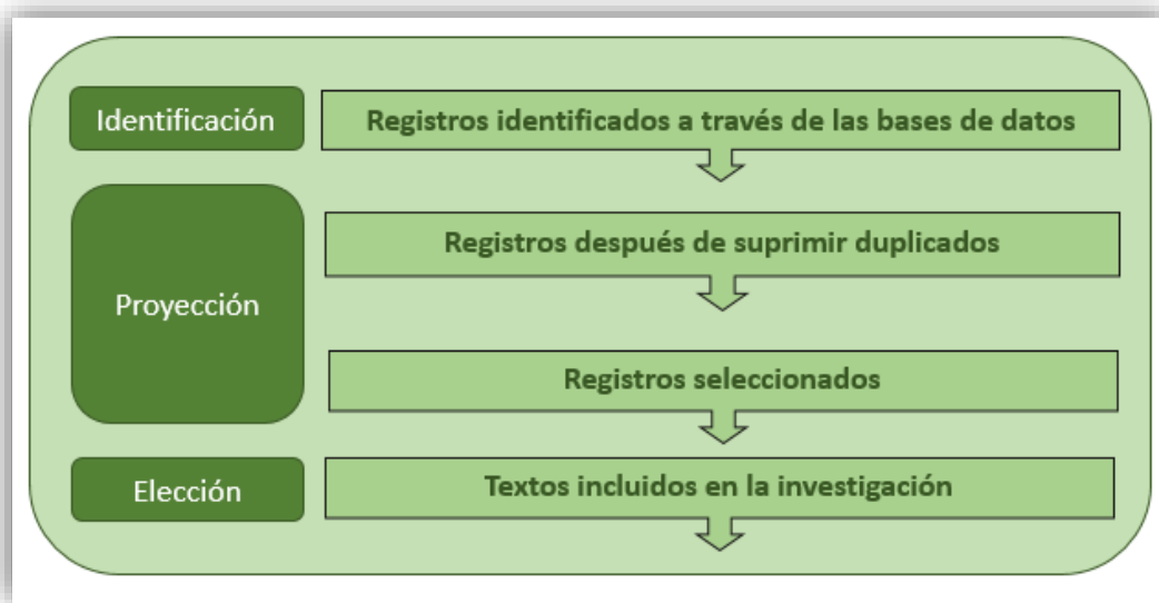
Figura 2: Revisión Sistemática