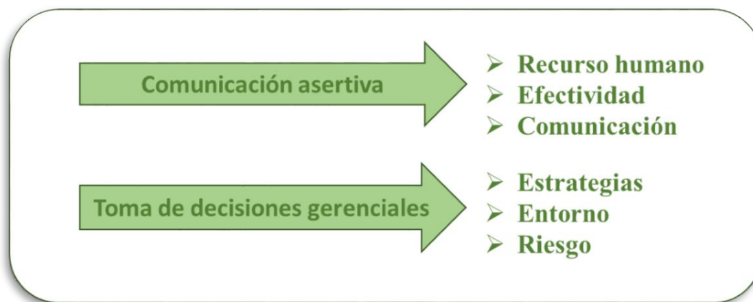
Figura 1: Variables

Dentro de las variables para poder realizar el análisis de la información se tiene en cuenta el uso de habilidades gerenciales que deben tener los líderes para el cumplimiento de los objetivos organizacionales propuestos. La toma de decisiones como elemento de reconocimiento de un problema cuya finalidad es escoger la mejor alternativa y su posterior desarrollo, teniendo como base la comunicación asertiva para el planteamiento de la solución del problema.