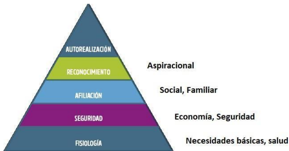
Figure 2. Adaptabilidad de los factores de la calidad de vida a la pirámide de Maslow. Fuente:

pues sus enfoques y propósitos de explicar el comportamiento humano son similares y podemos ver representados como se adaptan estos conceptos a la realidad del país. Evaluativamente se encuentran una serie de similitudes y diferencias entre el concepto de Maslow que fue desarrollado hace décadas como el planteamiento presentado en este ensayo, pues comprende la misma agrupación de características presentadas excepto la variable de autorrealización ya que hacen referencia a condiciones de desarrollo y aceptación personal, esta variable se encuentra inmersa dentro de las demás y no es especificada pues es el resultado de la satisfacción de las demás variables. Otra diferencia entre los dos conceptos es que en la pirámide se presenta un flujo de ascenso progresivo por lo que al satisfacer una de ellas se puede seguir con la siguiente, en cambio en el modelo comparado no tiene una estructura jerárquica y no tienen prerrequisito de un factor a otro.