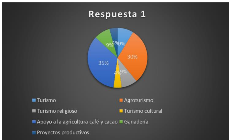
Ilustración 1 Expectativas de Futuro del Municipio de Guadalupe.