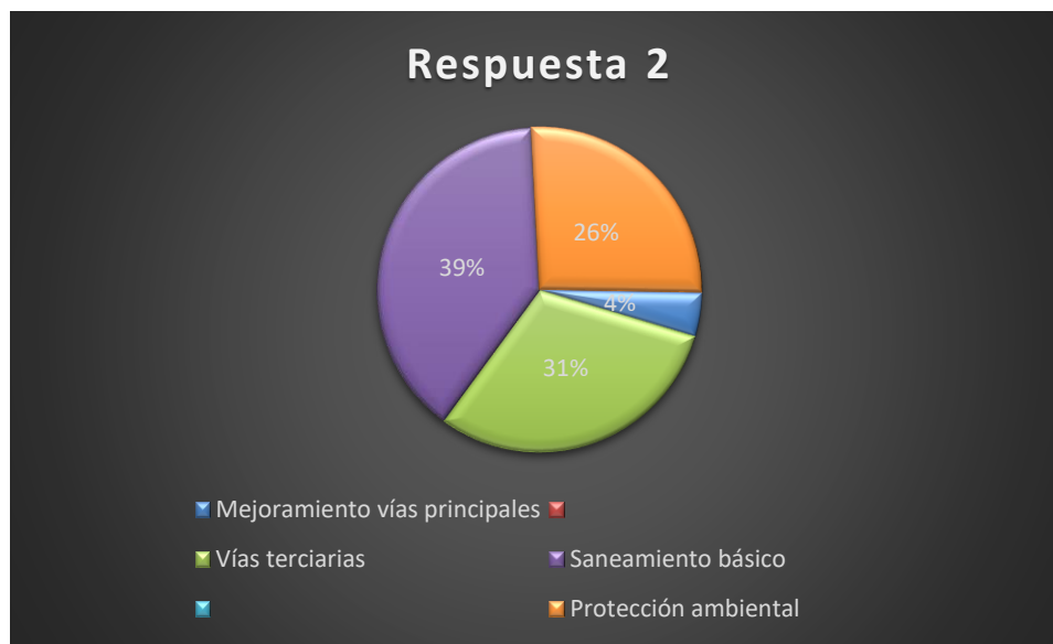
Ilustración 2. Proyectos que Deben Incorporarse al Nuevo Esquema de Ordenamiento Territorial