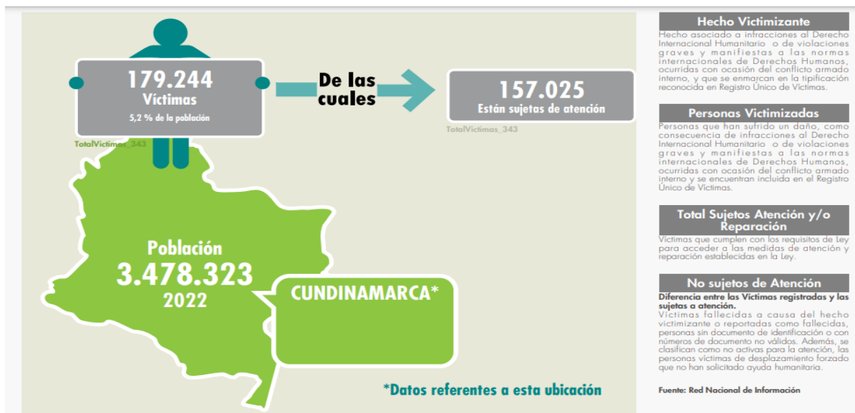
Ilustración 1 Boletín fichas estadísticas de Cundinamarca – Registro

Nota. Tomado: Red Nacional de Información, 28 de febrero 2022 ( Unidad para la Atención y Reparación Integral a las Víctimas, 2022 ).