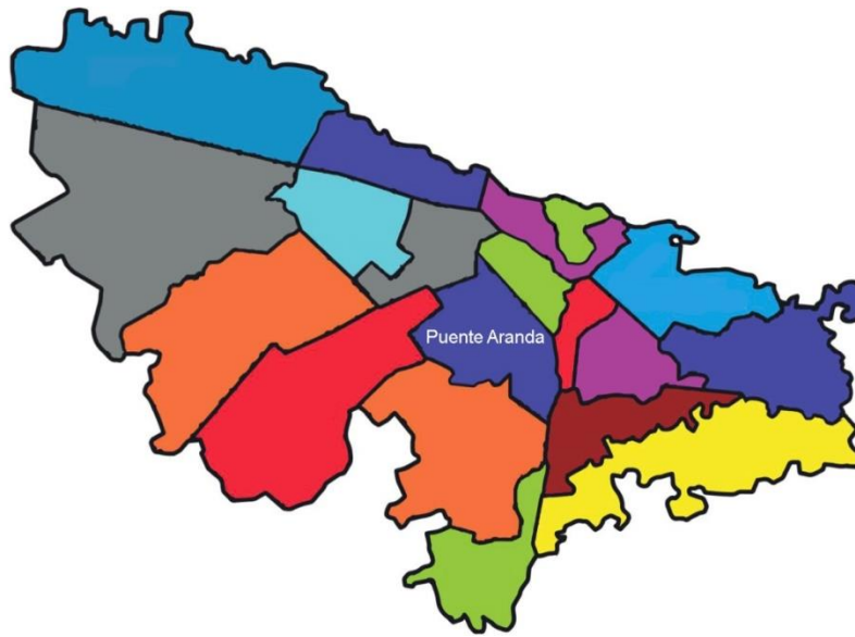
Figura No. 3 Mapa de la localidad de Puente Aranda en Bogotá.

Puente Aranda se convirtió en epicentro de la labor industrial y en sus alrededores se desarrollaron urbanizaciones residenciales que ampliaron el sector, donde hoy sigue siendo un polo de actividad y referente empresarial de la ciudad. (Ver mapa en la Figura No. 3)