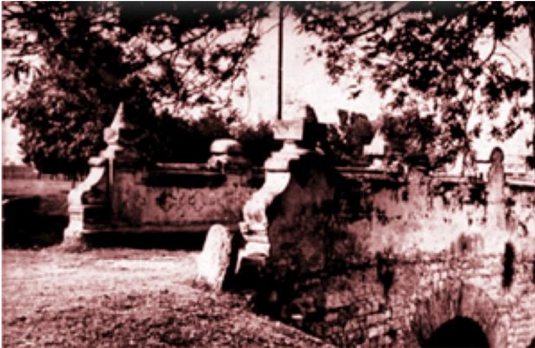
Figura 2. Puente Aranda que permitió la comunicación y el intercambio comercial hacia el occidente de Bogotá