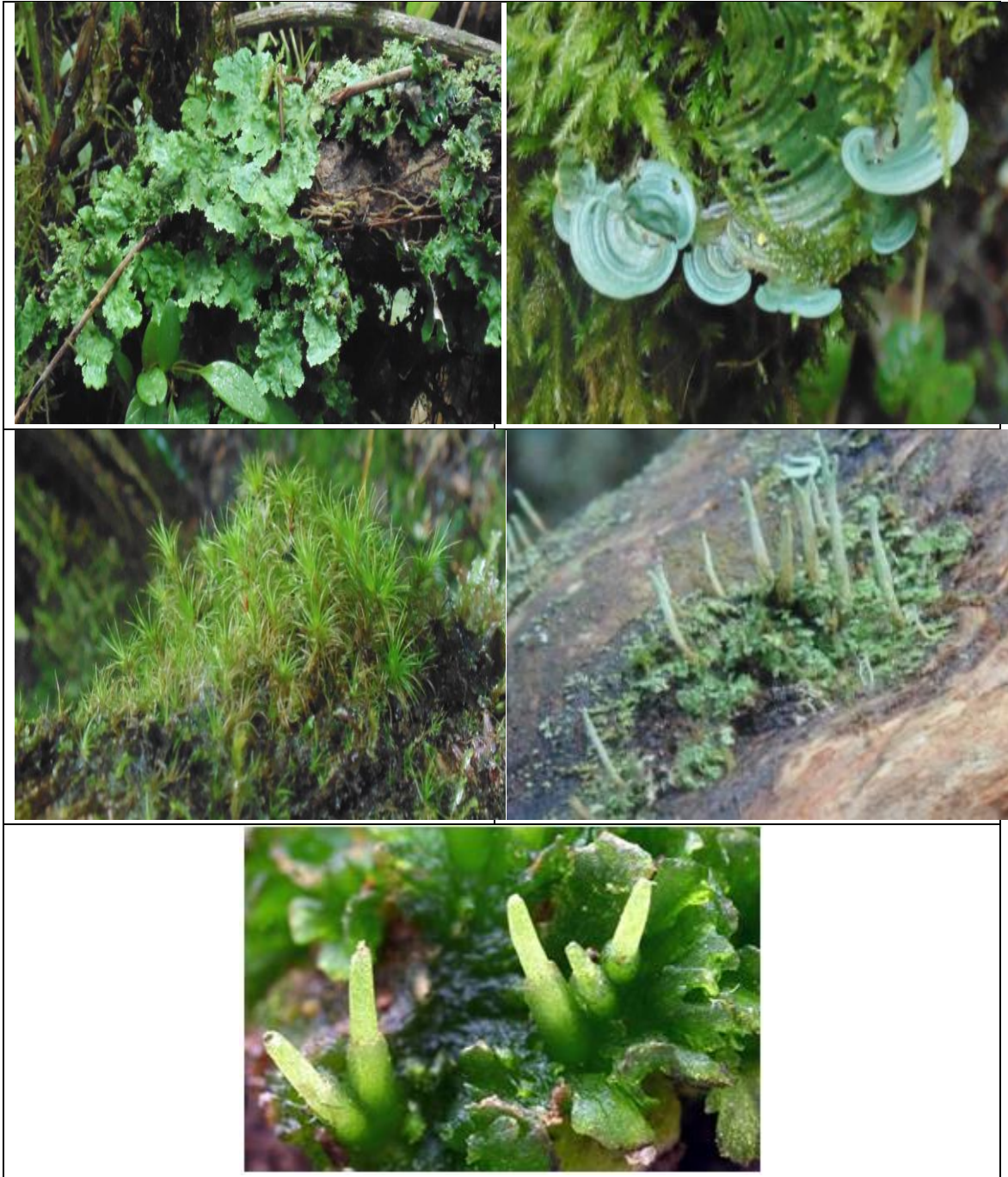
De izquierda a derecha Lunularia sp (Hepática). , Dyctionema glabratum (Liquen), Dicranum frigidum (Musgo), y Cladonia cornuta (Liquen)