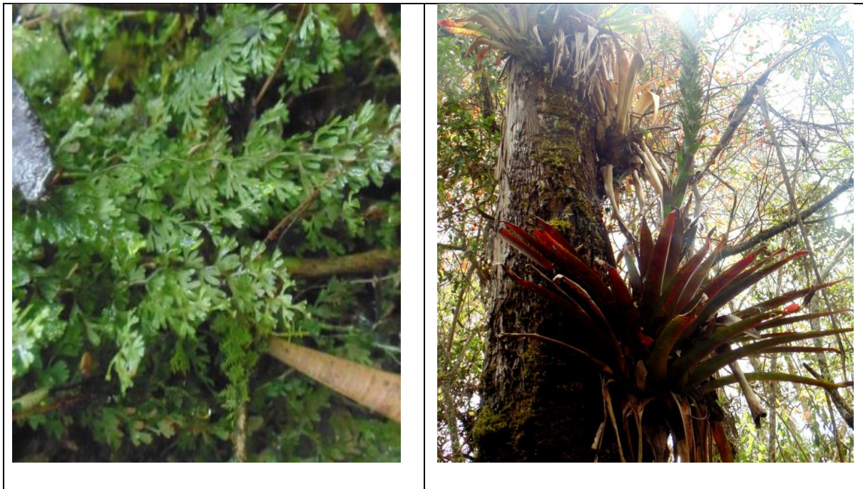
De izquierda a derecha Hymenophyllum axillare (Helecho), B Guzmania gloriosa (Bromelia)