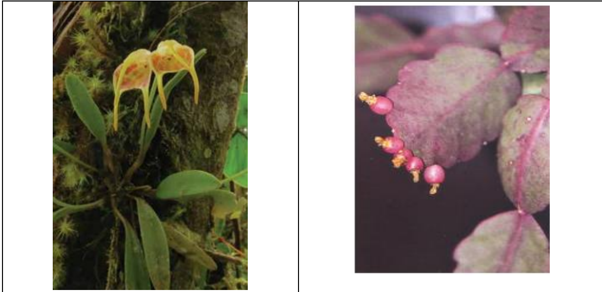
De izquierda a derecha Acinopetala (Masdevallia) geminiflora (Orquídea) y Rhipsalis elliptica (Cactus)