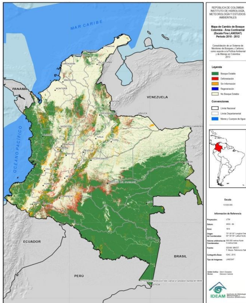
Figura Error! No text of specified style in document. -1 Puntos Activos de Deforestación Mapa de Cambios en la cobertura de Bosque, periodo 2010-2012

La pérdida en biodiversidad asociada a la destrucción de ecosistemas es enorme, actualmente se han identificado 2,500 especies que están bajo amenaza de extinción por deforestación, 500 de ellas especies nativas al país. Esto es especialmente grave si tomamos en cuenta que Colombia es uno de los 17 países megadiversos en el mundo. Entre las especies que se están perdiendo por esta situación encontramos especies arbóreas, especies animales y vegetación epífita.