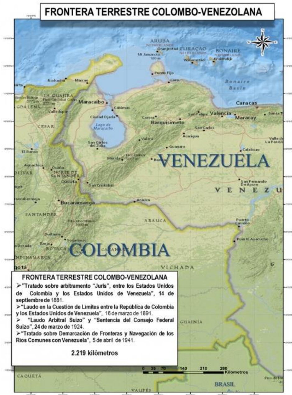
Imagen 2: Frontera terrestre colombo-venezolana

La delimitación de la frontera entre ambos países se ha acordado a través de varios instrumentos como lo son el Laudo español de 1891, el arbitramento del Consejo federal Suizo de 1922 y el Tratado López de Mesa – Gil Borges de 1941.