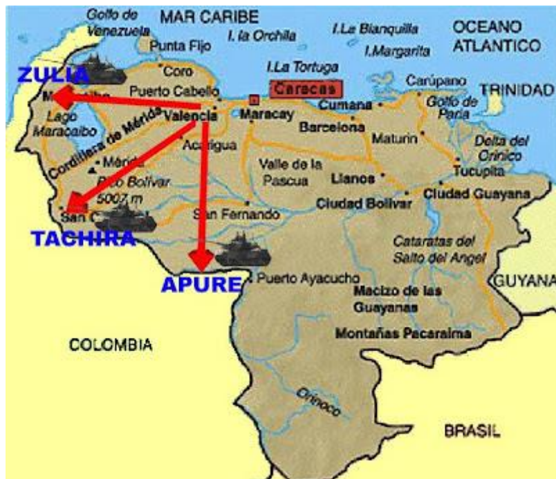
Imagen 1: Envío de tropas por parte de Venezuela a la frontera 2008

pospost. (03 de marzo de 2008). pospost . Recuperado el 19 de 09 de 2015, de http://pospost.blogspot.com/2008/03/grfico-tanques-de-venezuela-se-dirigen.html