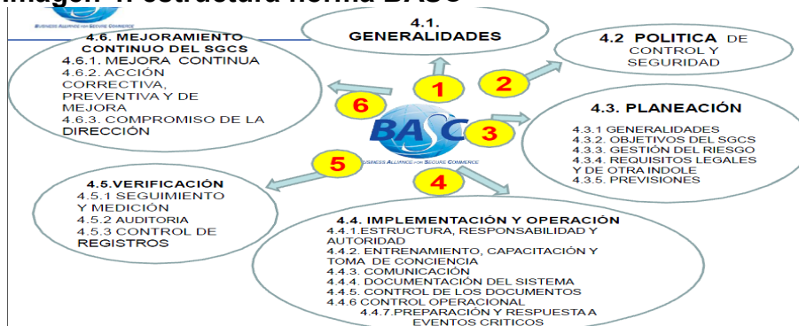
Imagen 4: estructura norma BASC

Para la protección de todas las actividades vinculadas al comercio exterior BASC implementa su normativa para garantizar la seguridad en la cadena de suministro estableciendo procedimientos para la gestión del control y seguridad para cualquier tipo de empresa relacionada con la cadena de suministros he implementado la gestión dictada por la norma en pro del mejoramiento del negocio, los puntos de aplicación de la norma BASC son apreciables en la imagen.