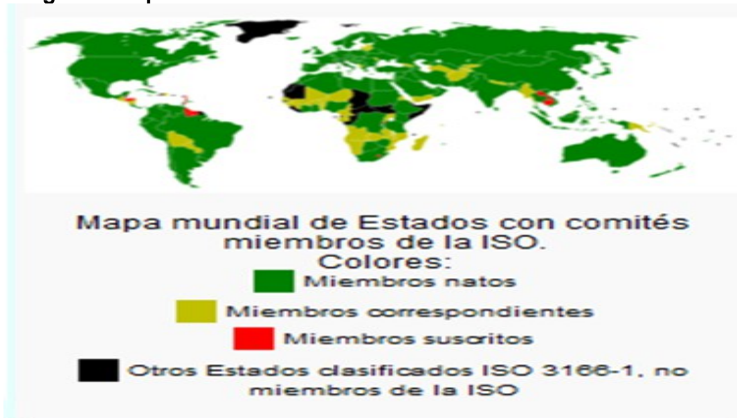
Imagen 5: mapa mundial miembros ISO