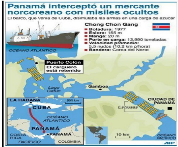
Imagen 8: contrabando de armas