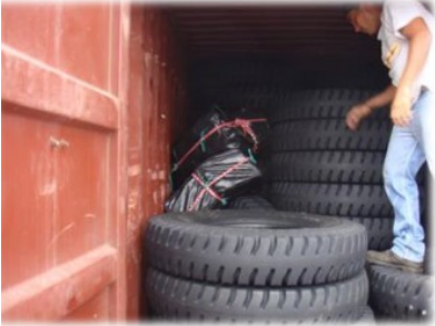
Imagen 6: contrabando en contenedores

Esa constante necesidad de cambio que presentan estas organizaciones ilegales se ve representada en las modalidades que han sido descubiertas por las autoridades el cual es apreciable en los casos de contrabando