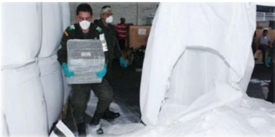
Imagen 7: lavado de activos

en la imagen numero 6 evidenciamos como contaminan un contenedor que transporta llantas y entre las llantas se encontraba la mercancía ilícita, en este caso cocaína con fines de exportación, al generar la inspección requerida por el control de planeación de riesgo se logra identificar dicha mercancía.