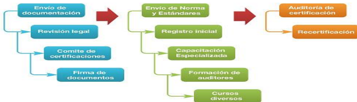
Gráfica 2, Proceso de certificación en la norma BASC (BASC, 2015).

De acuerdo a lo establecido en la norma internacional BASC el procedimiento de certificación se inicia presentando a la junta directiva del capítulo propio de la empresa, la solicitud de admisión y los documentos legales exigidos. Además debe proporcionar cualquier información o documentación que le sea requerida para los fines de evaluación y calificación de la solicitud de admisión.