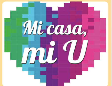
Imagen Institucional 2013

Universidad Militar Nueva Granada Rector: M.G. Eduardo Antonio Herrera Berbel Dirección General: Gral. Alberto Bravo Silva Responsable: Dra. Martha Patricia Striedinger Meléndez Editor: Edgar Andrés Castro Peña Concepto Gráfico: D.G. Mario Mejía Diagramación: División de Publicaciones y Comunicaciones Boletín Institucional 11 - Enero de 2013 www.umng.edu.co