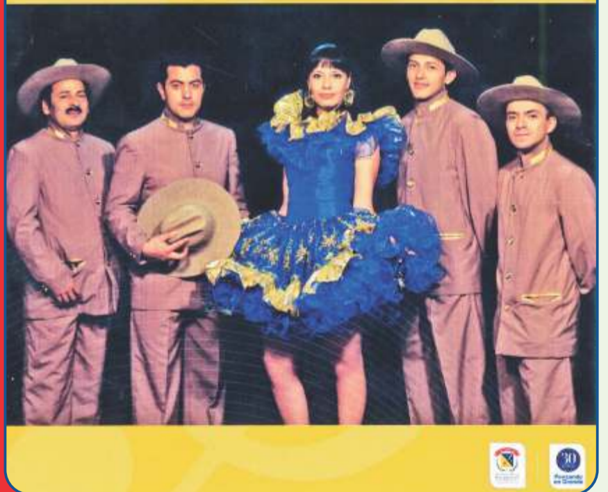
Carátula del disco del Grupo Llanero de la UMNG