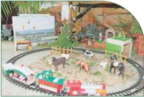
El tren se ha convertido en un símbolo de identidad neogranadina