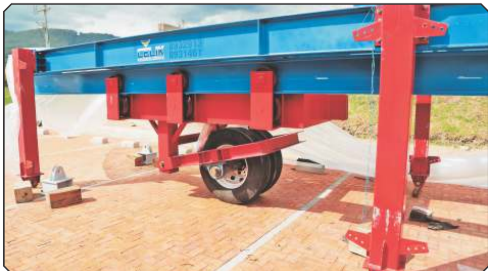
El dispositivo puede utilizarse con una o dos llantas, según la necesidad

Equipos de esta envergadura, según lo comentan los diseñadores del proyecto, solo los tienen cinco universidades de América Latina: dos en Brasil, una en Costa Rica y ahora, 2 en Colombia; la última de estas, la nuestra. La Pista de Ensayos de Pavimentos fue un equipo diseñado y ensamblado por personal neogranadino lo cual le da un gran valor simbólico. Las utilidades del equipo son infinitas pues tiene múltiples aplicaciones en investigación sobre: materiales, durabilidad, diseño y mantenimiento de vías; de igual manera puede prestar servicios a la empresa privada en las áreas de: planeación y diagnóstico y, prueba de materiales y aditivos. Esto sin contar que establece un punto de partida para que la Facultad de Ingeniería y particularmente el programa de Ingeniería Civil se proyecte como líder en el área vial y de pavimentos, produzca nuevo conocimiento y pueda crear nuevos programas académicos.