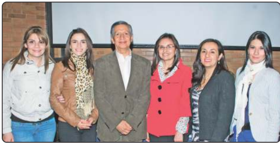
El Vicerrector General de la Institución y las responsables de los procesos de calidad en la Universidad celebran los resultados de la auditoría. Administrativos de todas las dependencias colaboraron con la organización del evento.

Como respuesta a las políticas del gobierno nacional y en el proceso de transformación y modernización del Estado, la Universidad Militar Nueva Granada implementó el Sistema de Gestión de Calidad.