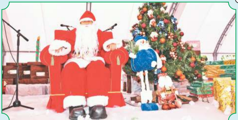
Papá Noel entregó los regalos a los niños y niñas asistentes

Mientras los adultos disfrutaban y departían, los pequeños visitantes pudieron divertirse en tres estaciones recreativas: la primera de ellas dedicada a la pintura facial, la segunda a la globoflexia y la tercera fue un taller donde los participantes crearon su propio árbol