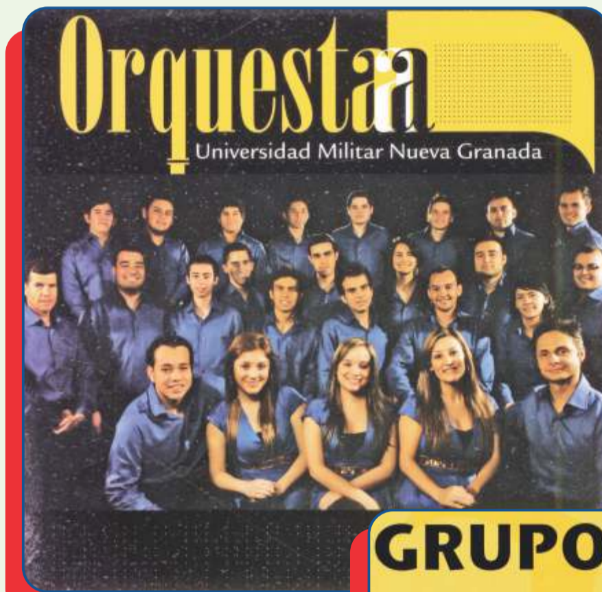
Carátula del disco de La Orquesta de la UMNG