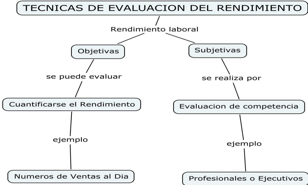
Figura 1. Técnicas De Evaluación Del Rendimiento

Elaboración Propia, basado en Técnicas de evaluación del Rendimiento , Fuente http://www.cepvi.com/trabajo/rendimiento.shtml