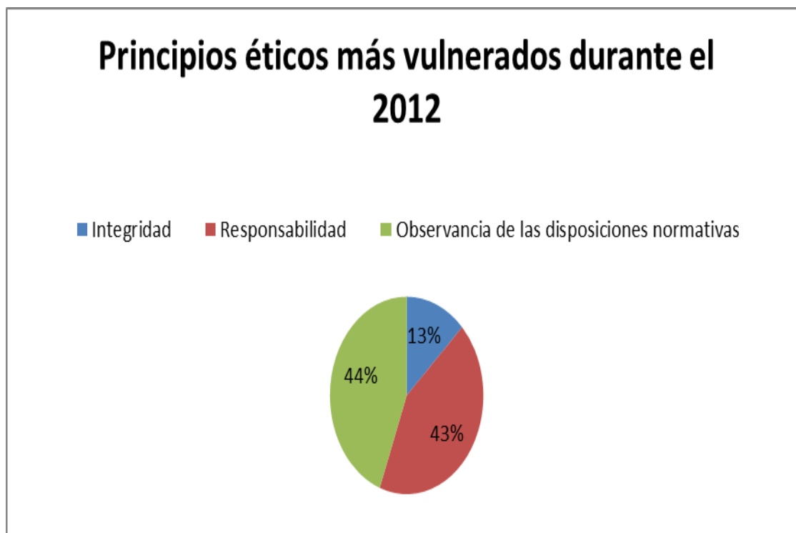
Figura1. Principios éticos más vulnerados durante el año 2012.

Elaboración propia, datos tomados de la Junta central de contadores.