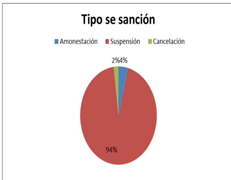
Figura 2. Tipo de sanciones impuestas durante el año 2012

Elaboración propia, datos tomados de la Junta central de contadores